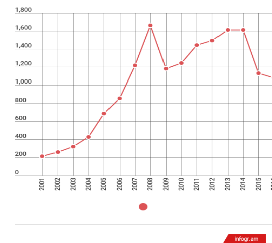
Evoluția transferurilor bănești externe în Republica Moldova (milioane dolari SUA)

http://lex.justice.md/viewdoc.php?action=view&view=doc&id=363576&lang=2